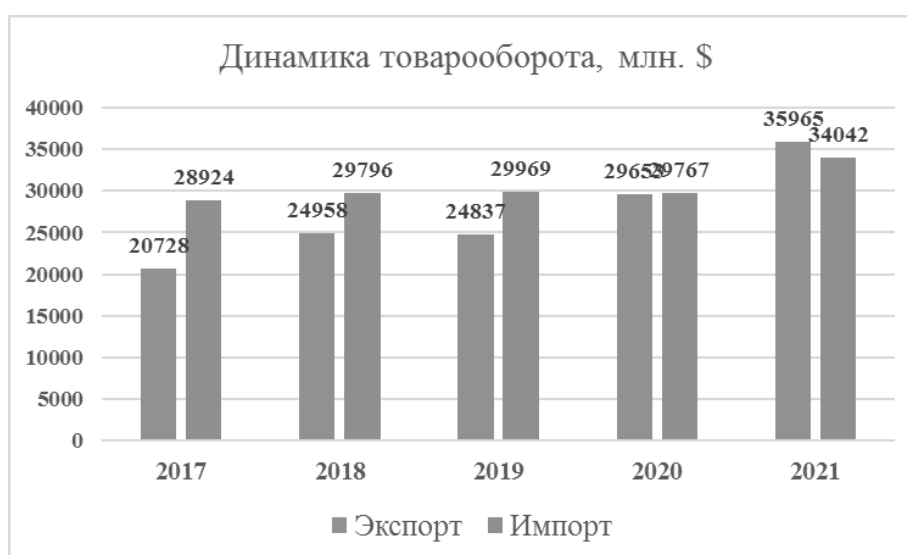
Рисунок 2 – Динамика экспорта и импорта продовольственных товаров ( по данным ФТС)