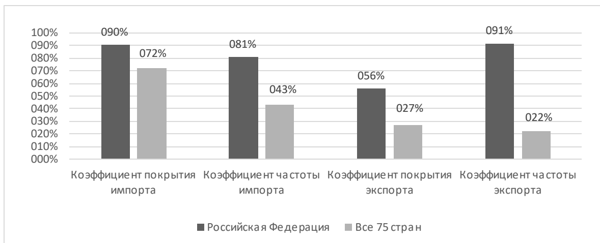
Рисунок 2 - Коэффициент покрытия и коэффициент частоты (частотный индекс), характеризующие степень применения нетарифных мер к экспорту и импорту Российской Федерации [там же]

Вместе с тем, по мнению Литвинова А.И. «...отдельные случаи подобных мер могут принести краткосрочный положительный эффект, но в среднесрочной и долгосрочной перспективе такая политика лишь замедляет темпы прироста ВВП и создает предпосылки для роста безработицы...» [Литвинов, 2023].