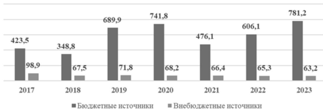
Рисунок 1 - Финансовое обеспечение сферы физической культуры и спорта в разрезе источников финансирования за 2017 – 2023 гг.

Финансовая поддержка, как уже было сказано выше, играет важную роль в деятельности организаций, действующих в сфере физической культуры и спорта. Подтвердим данное утверждение путем анализа отчета о финансовом обеспечении сферы физической культуры и спорта в разрезе источников финансирования, представленном на рисунке 1.