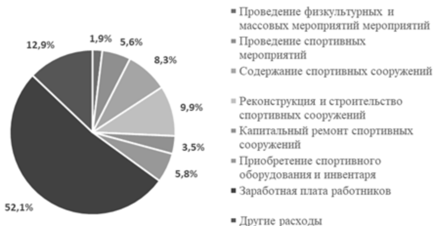
Рисунок 2 - Финансовое обеспечение сферы физической культуры и спорта в 2023 году

На основании финансового обеспечения сферы физической культуры и спорта представленном на рисунке 2, проанализируем финансовые приоритеты данной отрасли.