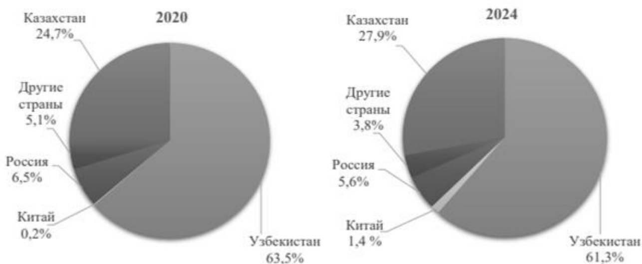
Рисунок 3 – Структура въездного туристического потока в Кыргызскую Республику по странам гражданства (прибытия), 2024 г. (% к итогу)