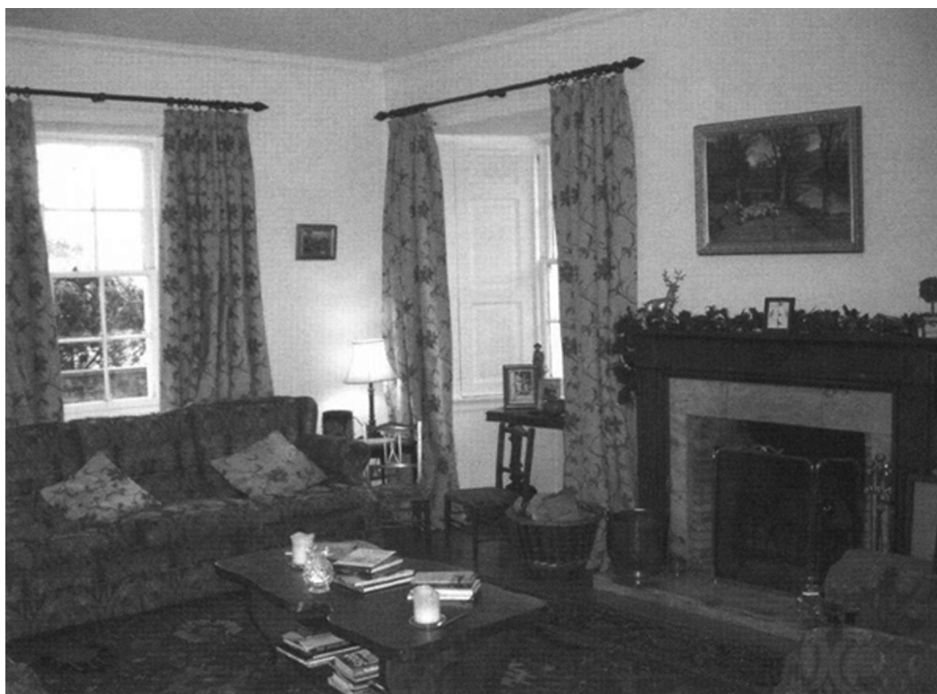
Рисунок 3. Зал в фермерском коттедже, Петршир, Шотландия [Maudlin, 2009, 49]

Такой дом бывал как минимум в два раза больше обычного черного дома. Комнаты располагались симметрично, внизу были кухня и гостиная, наверху – спальни. Стены были оштукатурены и украшены простыми классицистическими деталями, такими как карнизы. На больших окнах были занавеси на карнизах. Обычным делом были заводская мебель, ковры, картины на стенах (рис. 3).