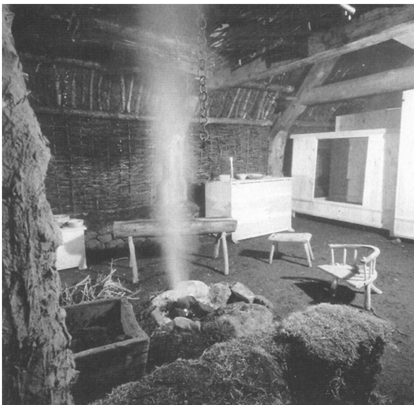
Рисунок 2. Интерьер «черного дома» в Шотландии, современная реконструкция. Highland Folk Museum, Кингасси, Шотландия [Maudlin, 2009, 47]