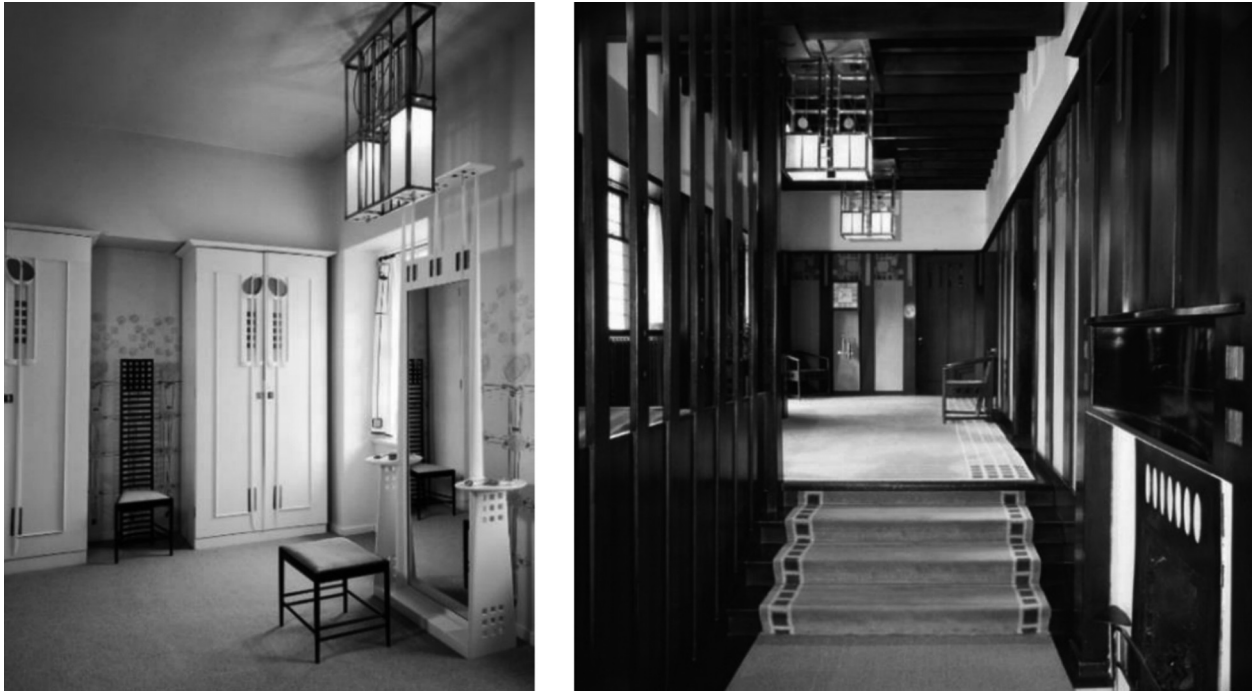
Рисунок 5. Интерьеры Hill Hause, спроектированные Ч. Макинтошем [Поляков, Дончук, 2018, 21]

и в разработку жилых интерьеров, оформив не только свой дом, но и Hill Hause – усадьбу книжного издателя Уолтера Блэки в Хеленсборо (пригород Глазго, 1902–1904 гг.; рис 5).