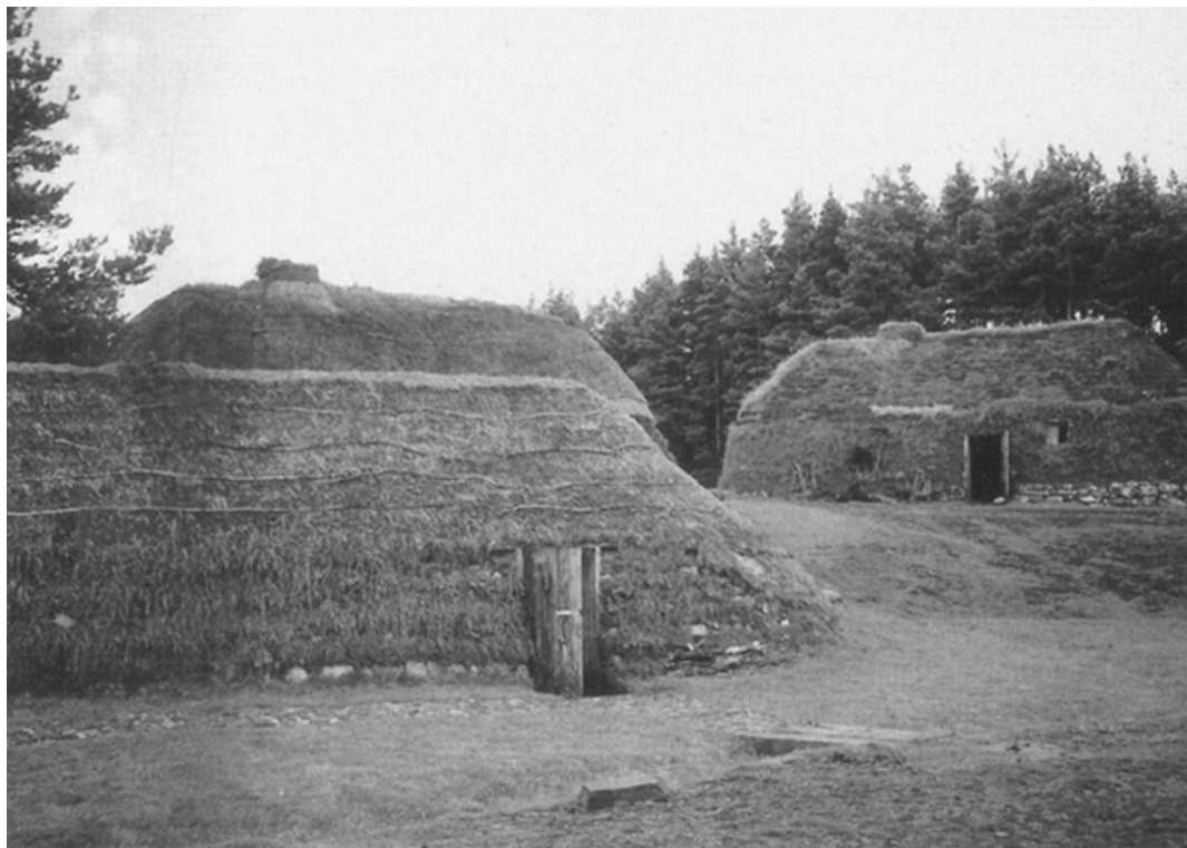
Рисунок 1. Традиционная деревня начала XVIII в. в Шотландии, современная реконструкция. Highland Folk Museum, Кингасси, Шотландия [Maudlin, 2009, 46]