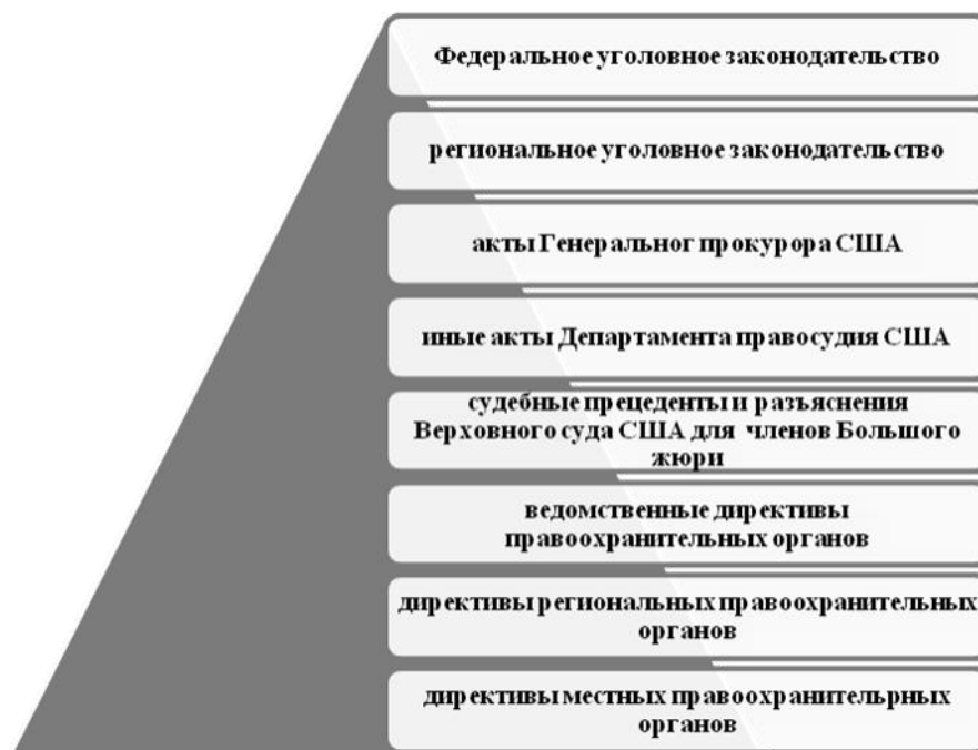
Рисунок 2 – Правовая основа реализации регулятивного направления уголовно-правового обеспечения ОРД в США

В США существует мероприятие, предполагающее тайное внедрение в криминальную среду, и вопросы о мнимом соучастии, о правомерной провокации, о сопутствующем причинении вреда в рассматриваемом государстве регламентированы более объемно и юридически грамотнее, чем в континентальной системе права.