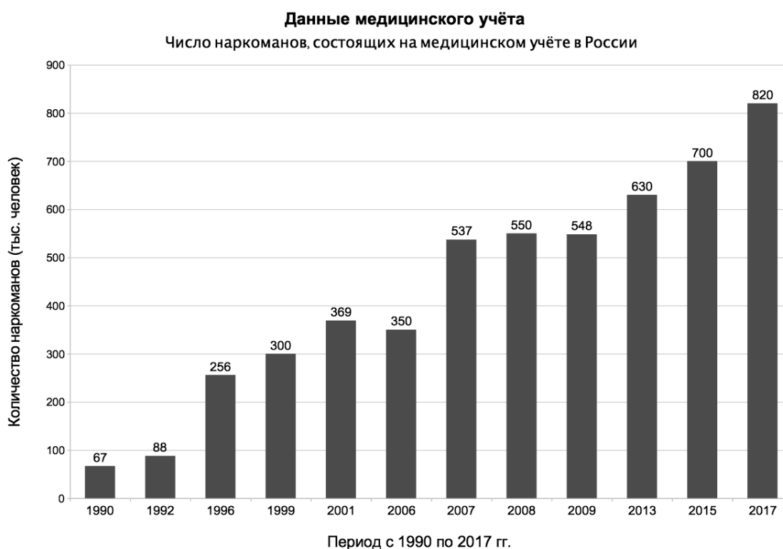
Рисунок 1 – Число наркоманов, состоящих на медицинском учете в России

На сегодняшний день в нашей стране на официальном медицинском учете состоят более 820 тыс. наркоманов. Анализ статистических данных, представленных на рис. № 1, позволяет сделать вывод о негативном тренде наркозависимых из числа лиц, находившихся на учете в медицинских организациях в России в период с 1990 по 2017 г. [Официальный сайт..., www].