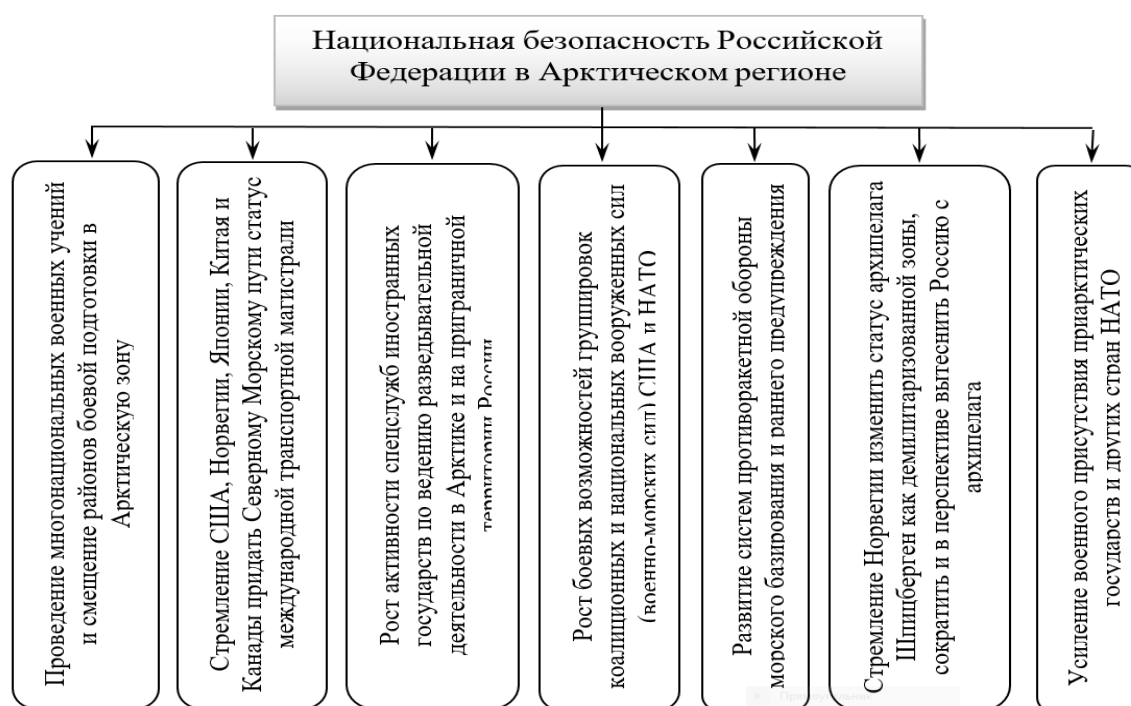
Рисунок 3 - Перечень угроз национальной безопасности России в Арктическом регионе [Смирнова, Липина, Соколов, 2017]

В частности, Норвегия предъявила территориальные претензии на участок шельфа «Свод Федынского», где по исследовательским данным, запасы нефти равны Тимано-Печорскому месторождения, а запасы газа – Штокмановскому.