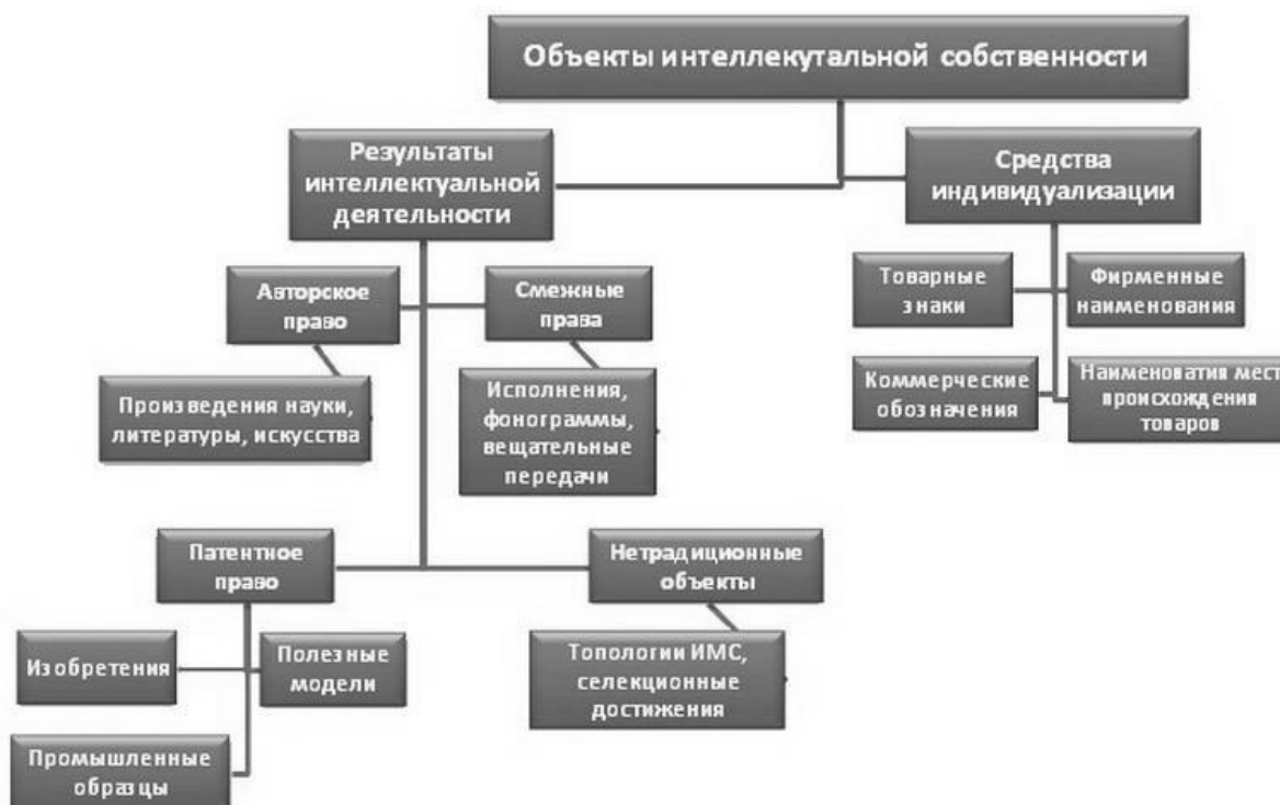
Рисунок 1. Структура объектов интеллектуальной собственности – РИД

РИД могут быть представлены в различных формах, таких как изобретения, научные открытия, литературные произведения, музыкальные композиции, программное обеспечение и т.д. (рис. 1).