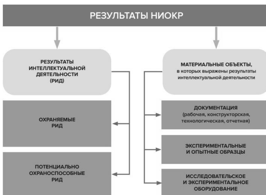
Рисунок 2 - РИД как элемент системы результатов научно-исследовательской деятельности

Охрана РИД является важным аспектом правовой защиты интеллектуальной собственности. Она направлена на обеспечение эксклюзивных прав на созданные интеллектуальные продукты, такие как изобретения, промышленные образцы, товарные знаки, авторские произведения и т.д. (рис. 3).