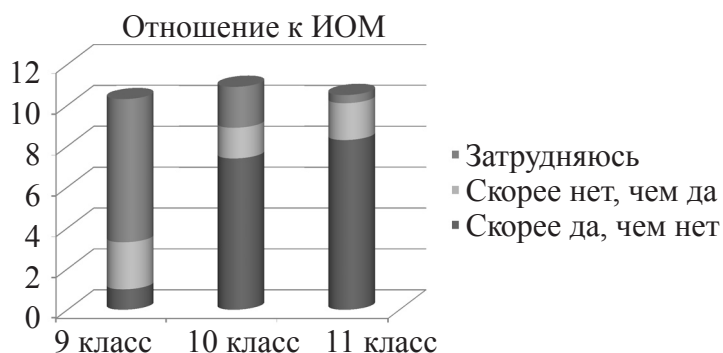
Рис. 2. Процент школьников, высказывающих положительное отношение к ИОМ

Чем старше ступень обучения, тем большее количество обучающихся одобряют и выбирают дистанционную форму обучения.