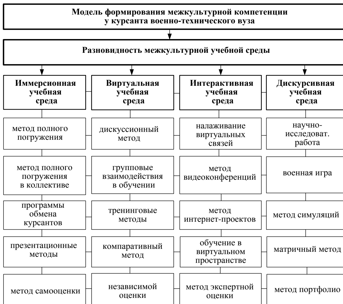
Рисунок 1 – Модель формирования межкультурной коммуникативной компетенции курсантов технических вузов согласно разновидности межкультурной учебной среды