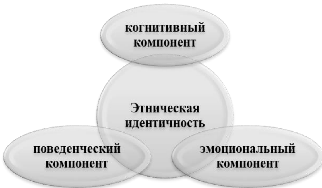
Рисунок 1 - Структура этнической идентичности

Указанное образование носит ярко выраженный деятельностный характер, находится в состоянии перманентного динамического развития, адаптации личности к условиям социально-природной окружающей среды, принятия системы аксиологических модусов, социально одобряемых на конкретном этапе исторического развития поведенческих паттернов, восприятия норм и ценностей общества в качестве лично значимых.