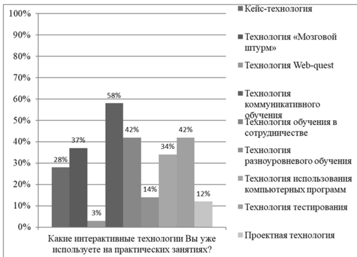
Рисунок 2 - Наиболее популярные интерактивные технологии, применяемые на занятиях по английскому языку