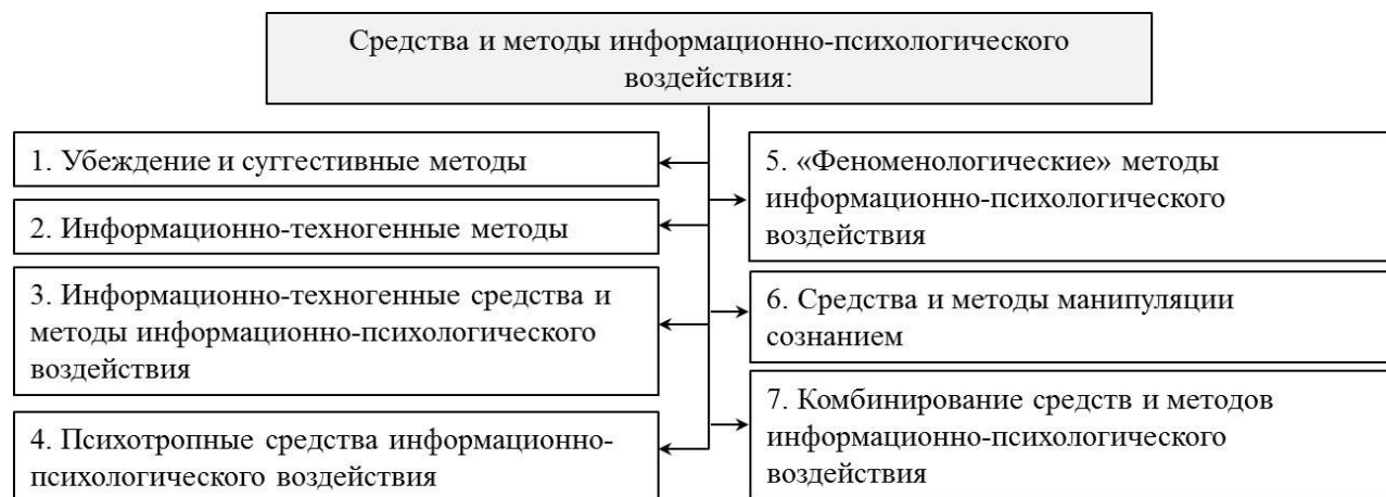
Рисунок 2 – Классификация средств и методов ИПВ