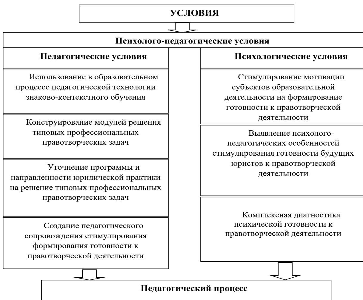
Рисунок 3 - Комплекс психолого-педагогических условий формирования готовности будущих юристов к правотворческой деятельности

Комплекс выявленных и разработанных в нашем исследовании психолого-педагогических условий можно представить схематично в виде единой системы, обеспечивающей функционирование такого сложного процесса, как стимулирование формирования готовности будущих юристов к правотворческой деятельности (рис. 3).