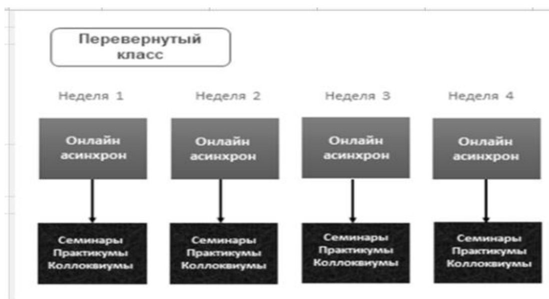
Рисунок 2 - Технология «Перевёрнутый класс»

Использование коммуникативного подхода решает сложную проблему формирования и развития мобильной, самореализующейся личности, которая умеет ориентироваться в современном обществе и принимает правильные решения, основанные на данных различных источников и собственного опыта, знаний и навыков [Исакова, 2017].