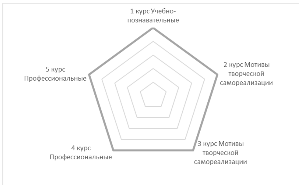
Рисунок 2 - Ведущие мотивы студентов разных курсов

Наибольший уровень мотивации имеют студенты 1, 2 и 3 курсов, а в старших курсах - 4 и 5 курсы, их уровень мотивации низкий. У студентов первого курса наиболее выражены среди мотивов профессиональные и учебно-познавательные, у студентов второго и третьего курса – творческой самореализации, у четвертого и пятого курса – профессиональные. Это свидетельствует о том, что студенты, только поступившие на первый курс, нацелены на учебу и не вовлечены в различные процессы университета. На втором и третьем курсе – студенты, начинают активно втягиваться в различные мероприятия группы, института, университета и более ориентированы на творческий поиск «себя» в университетской жизни. Снижение мотивации в старших курсах возможно объясняется тем, что выпускники в это время заняты поиском работы, карьеры, некоторые уже работают и имеют семьи, детей и в приоритете находится семья.