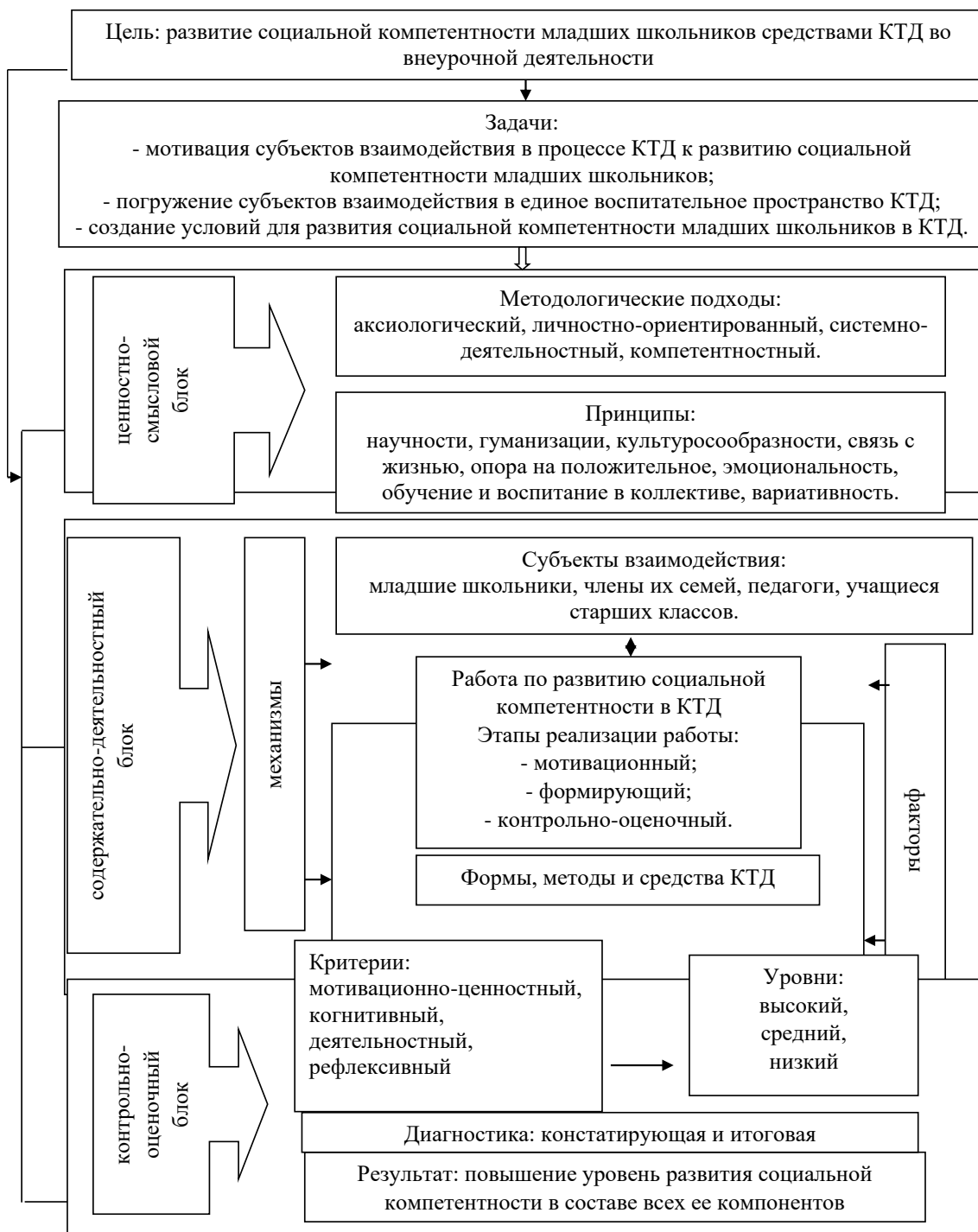
Рисунок 3 - Модель повышения уровня социальной компетентности младших школьников в процессе коллективно творческой деятельности

деятельности бала проведена повторная диагностика уровня развития детей экспериментальной и контрольной группы.