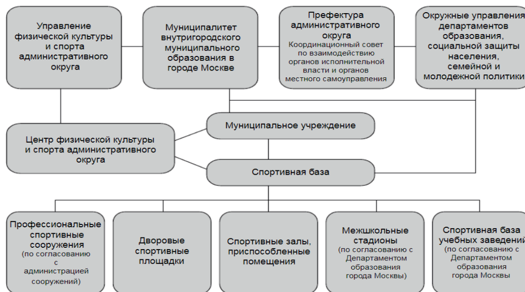
Рисунок 2 - Схема взаимодействия органов местного самоуправления с окружными и районными структурами по организации физкультурно-оздоровительной и спортивной работы с населением [Никитушкина, www]

На рисунке 2 представлена схема взаимодействия органов местного самоуправления с окружными и районными структурами по организации физкультурно-оздоровительной и спортивной работы с населением.