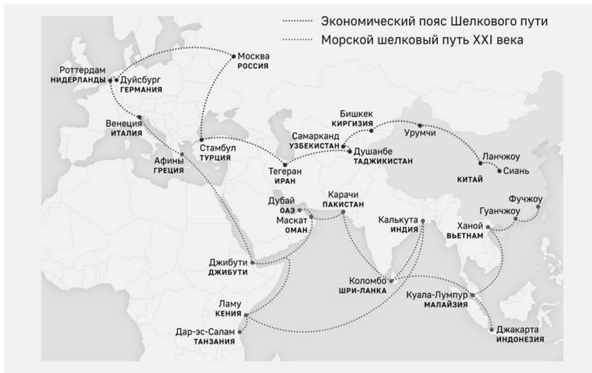
Рисунок 2 - Инициатива «Один пояс и один путь» и ее отдельные элементы