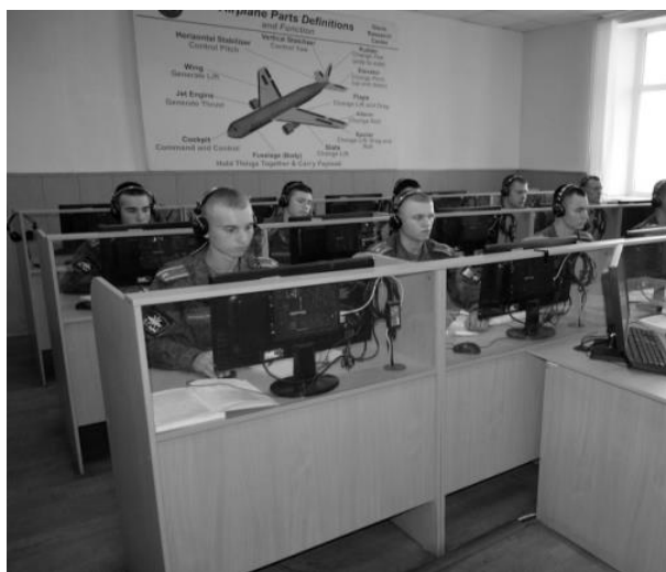
Рисунок 1 - «Лингафонная аудитория с отдельными оборудованными компьютерными рабочими местами на кафедре иностранных языков»

Лингафонные аудитории с отдельными оборудованными компьютерными рабочими местами – это неотъемлемая часть процесса обучения авиационному английскому языку. Такое оборудование обеспечивают проведение аудирования, тестирования, контроля с помощью технических средств обучения (рис. 1). Кроме этого, является отличным помощником в объяснении построении диалога «диспетчер-пилот» на разных этапах изучения тем авиационного английского языка. В таких аудиториях достаточно легко организовывать интеллектуальные турниры, ролевое обучение, олимпиады.