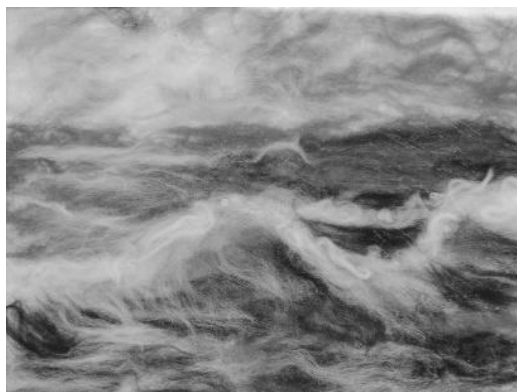
Рисунок 4 - Работа из ниток