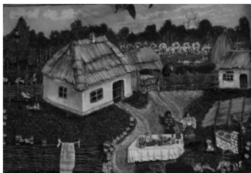
Рисунок 8 - Природный материал