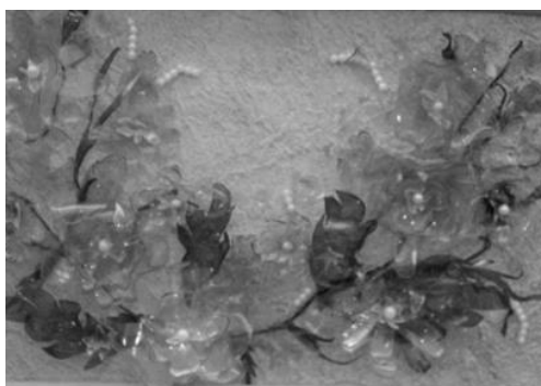
Рисунок 9 - Работа из пластика