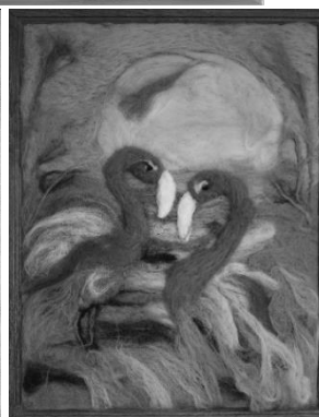
Рисунок 5 - Валяние