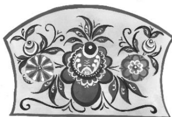
Рисунок 2 – Роспись