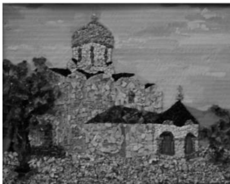
Рисунок 3 - Природный материал