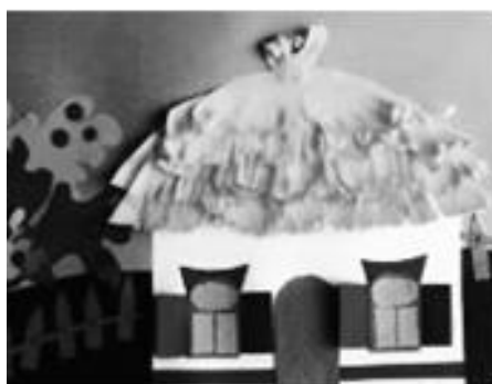
Рисунок 7 - Коллаж