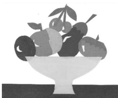
Рисунок 1 – Аппликация

Высокий уровень характерен для детей, которым достаточно только подсказать направление поиска чего-то, им лично знакомого, и они быстро определяют замысел для своего рисунка.