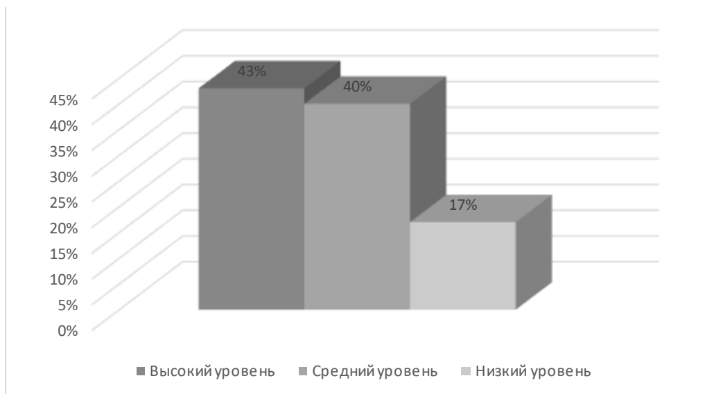
Рисунок 2 - Результаты контрольного этапа

Чтобы выявить наличие динамики в уровнях нравственной воспитанности дошкольников после проведения формирующего этапа, необходимо осуществить сравнительный анализ диагностических этапов исследования, детали которого представлены в таблице 3 и на рисунке 3.