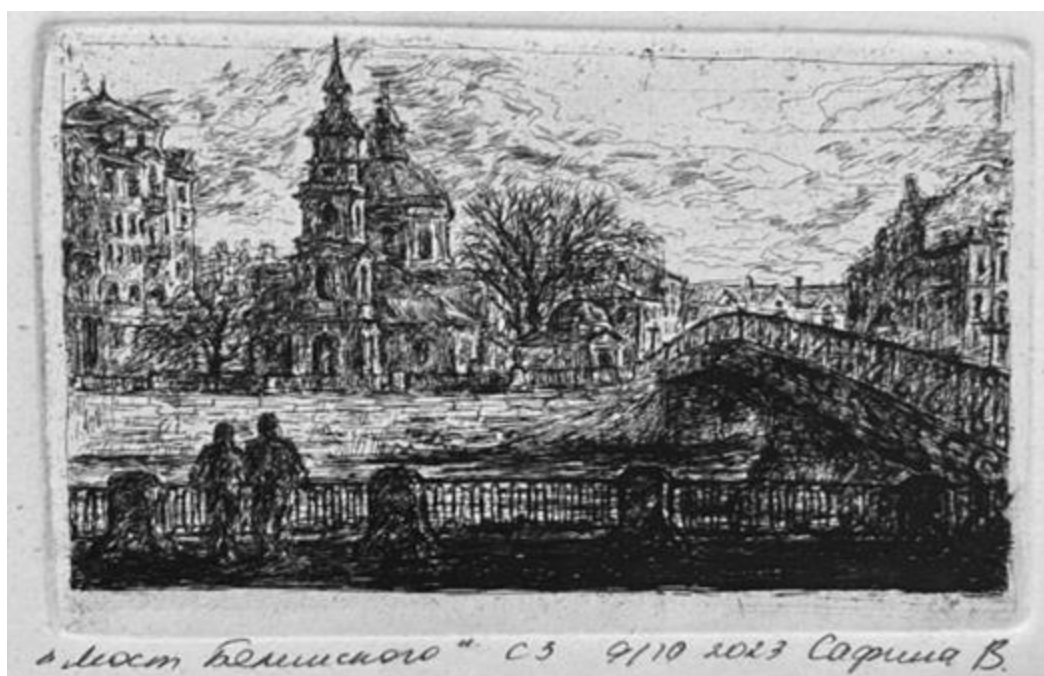
Рисунок 3 — Сафина В. «Мост Белинского», офорт 2023, печатная форма

На этом задании студенты закрепляют технические знания, полученные в ходе копирования офортов старых мастеров, а также применяют освоенные навыки в работе со штриховкой, деталями, передачей воздушной перспективы и работе с композицией листа. Как правило, в качестве идеи для офорта выбирается одна из работ студента в уникальной графической технике, выполненная ранее на натурной практике. Например, учебный рисунок по теме «Городской пейзаж с парковым фрагментом», который является одним из первых заданий в учебной программе по рисунку на направлении «ландшафтная архитектура». Выполняя это задание, студенты учатся гармонично сочетать природные и городские элементы в единой композиции. Постепенно они осваивают организацию пространства листа, анализ натуры с различных ракурсов и выявление взаимосвязей между архитектурой и ландшафтом. Работа включает сопоставление пропорций зданий, деревьев и рельефа, тональное выделение главных элементов и подчинение им второстепенных деталей. В результате формируется умение создавать сбалансированные работы, где тщательная проработка деталей сочетается с целостностью восприятия. [Шабанова, 2023]