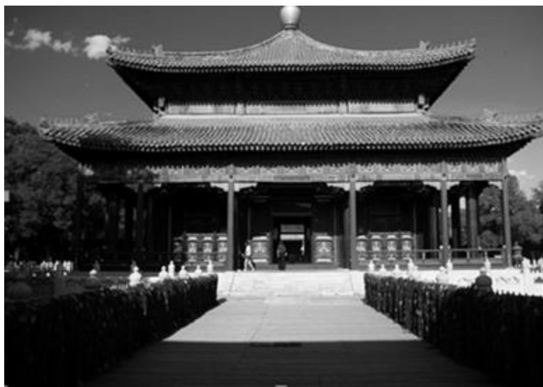
Рисунок 3 - Храм Конфуция, г. Цюйфу