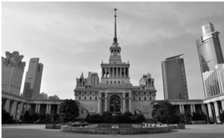
Рисунок 7 - Дворец советско-китайской дружбы, г. Шанхай (1954 г.)

После образования Китайской Народной республики в 1949 году начался период масштабных градостроительных преобразований. Архитектурный стиль Советского Союза оказал значительное влияние на формирование облика городов социалистического Китая. Необходимо отметить, что в период с 1945 по 1965 год, политика этих двух стран были тесно связаны. В 1950 году развивалась «концепция социалистических городов», которая положила начало новому китайскому стилю «Су» (советский стиль по-китайски), а также строительству крупных градостроительных объектов [Цапенко, 1955, 112]. В этот период в КНР возводились монументальные здания с высокими шпилями и башнями. Архитектура отличалась симметрией и строгостью форм, трехчастной структурой и центральной частью, которая выше боковых, а также преобладанием прямых линий и правильных геометрических фигур.