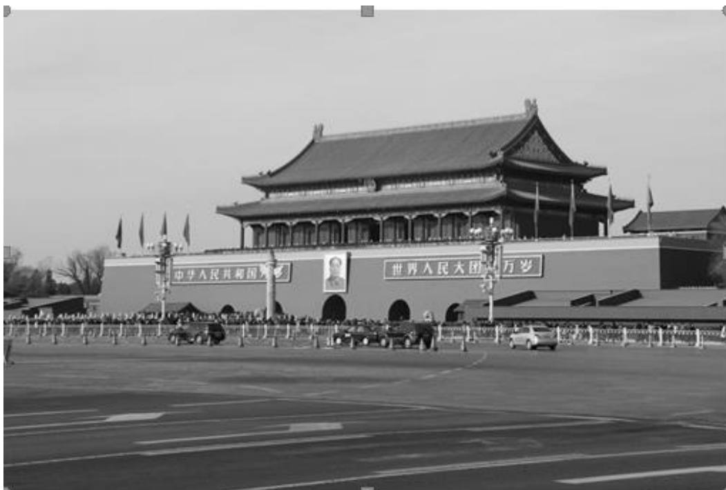
Рисунок 11 - Площадь Тяньаньмэнь в центре Пекина

Одной из самых известных построек стал Дом народных собраний в Пекине, построенный в 1959 году (рис.12). Здание площадью более 170 тыс. кв. м. имеет высоту 46,5 м. и вмещает в себя концертный зал, театр и несколько выставочных залов.