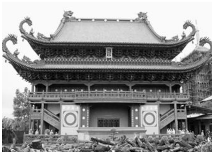
Рисунок 1 - Пагода в городе Гуйлинь

Китай – страна с богатой и многовековой историей, которая сформировала уникальную культуру. Она характеризуется глубокой традицией и уважением к прошлому, а также огромным вкладом в развитие искусства, философии и науки.