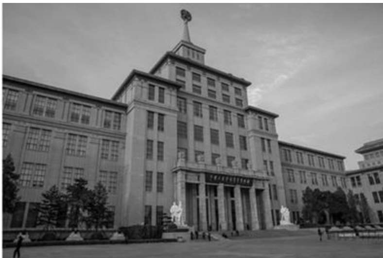
Рисунок 9 - Военный музей китайской народной революции, г. Пекин

Ярким примером «советского дома» в Пекине является Пекинский выставочный центр, созданный по просьбе Советского Союза для демонстрации в Китае достижений развития СССР (рис.8). Другой пример – Военный музей китайской народной революции (постройка 1959 года), который расположен на западе главного столичного проспекта Чанъаньцзе (рис.9).