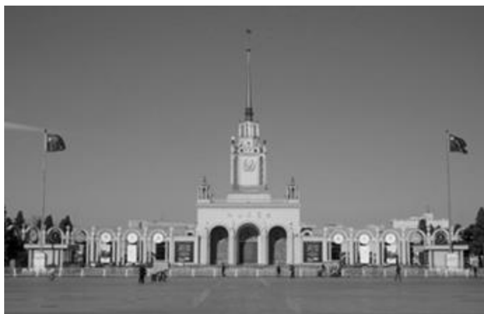
Рисунок 8 - Пекинский выставочный центр

Здания советского стиля в Китае можно разделить на две категории: «полноценные советские дома» и «гибриды китайской и советской архитектуры» [там же, 118]. Первая категория особенна тем, что в конструировании и строительстве приняли участие советские архитекторы. Во второй категории сочетаются особенности архитектуры советского стиля с традиционной широкой китайской крышей и национальными украшениями.