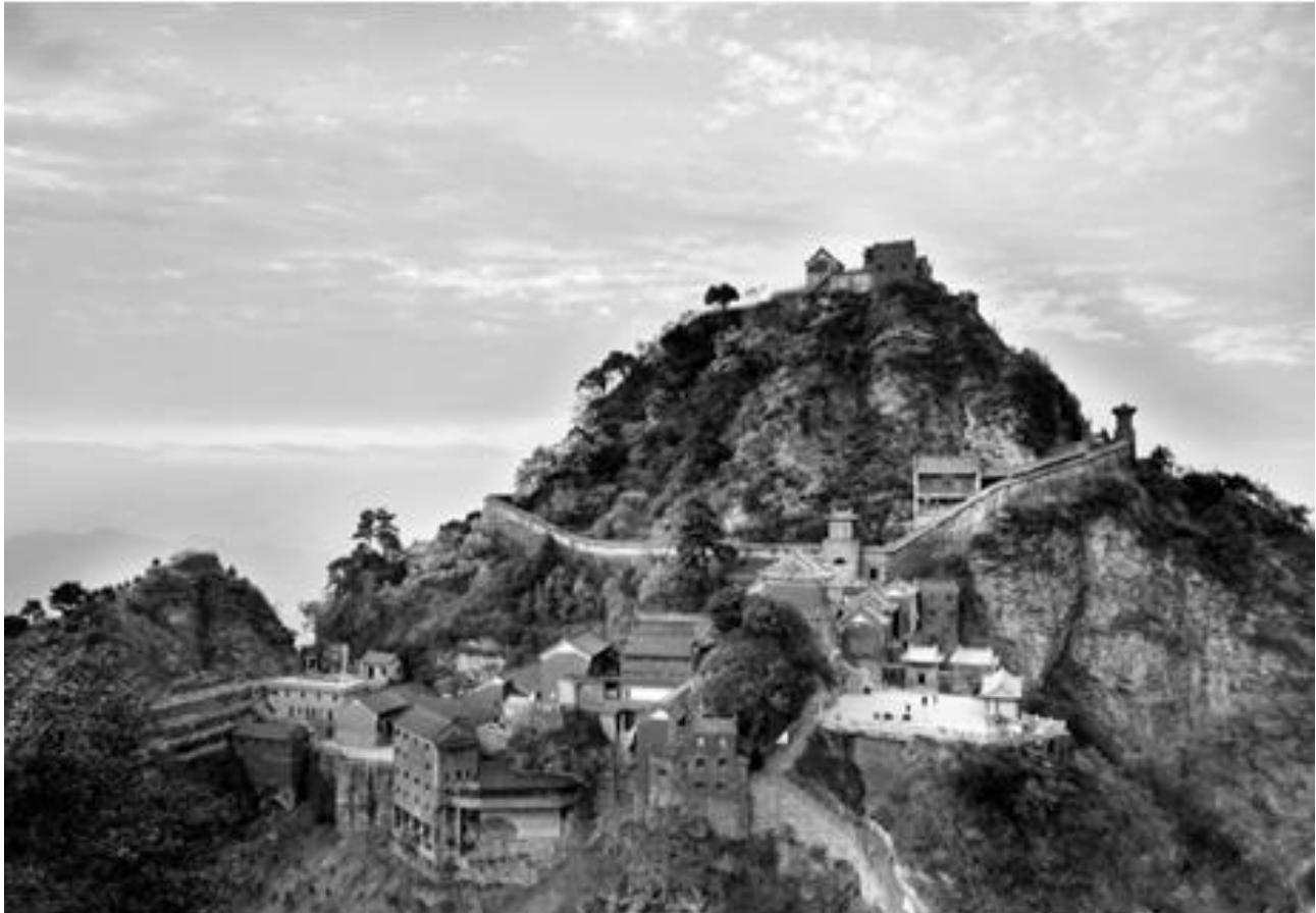
Рисунок 5 - Даосский Храм в горах Уданшань

Философ писал: «Человек следует Земле, Земля следует небу, Небо следует дао, а дао следует самому себе» [там же, 45]. Китайские сады, которые являются важной частью китайской архитектуры, непосредственно отражают принципы даосизма, где природа и искусство сливаются воедино.