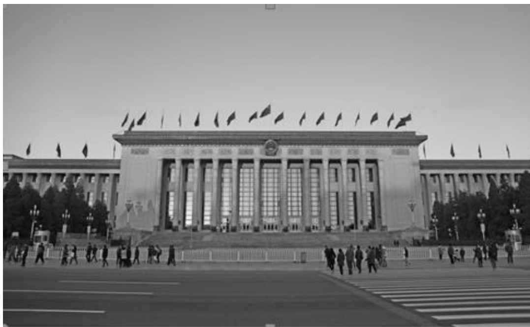
Рисунок 12 - Дом народных собраний в Пекине

Одной из самых известных построек стал Дом народных собраний в Пекине, построенный в 1959 году (рис.12). Здание площадью более 170 тыс. кв. м. имеет высоту 46,5 м. и вмещает в себя концертный зал, театр и несколько выставочных залов.