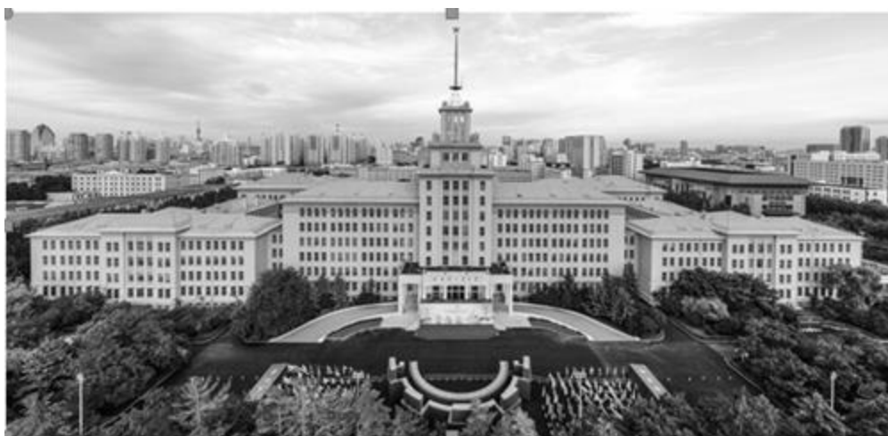
Рисунок 10 - Здание Харбинского политехнического университета

В городе Харбин повсеместно присутствует советский архитектурный стиль, который называют «русский Харбин». Этот термин включает начальный исторический период в становлении города, когда в Харбине преобладало преимущественно российское население, а город возводили архитекторы и инженеры из России. По проектам советских архитекторов был построен ряд крупных сооружений, которые определили новый образ города. К примеру, здание политехнического университета в г. Харбин (рис.10):