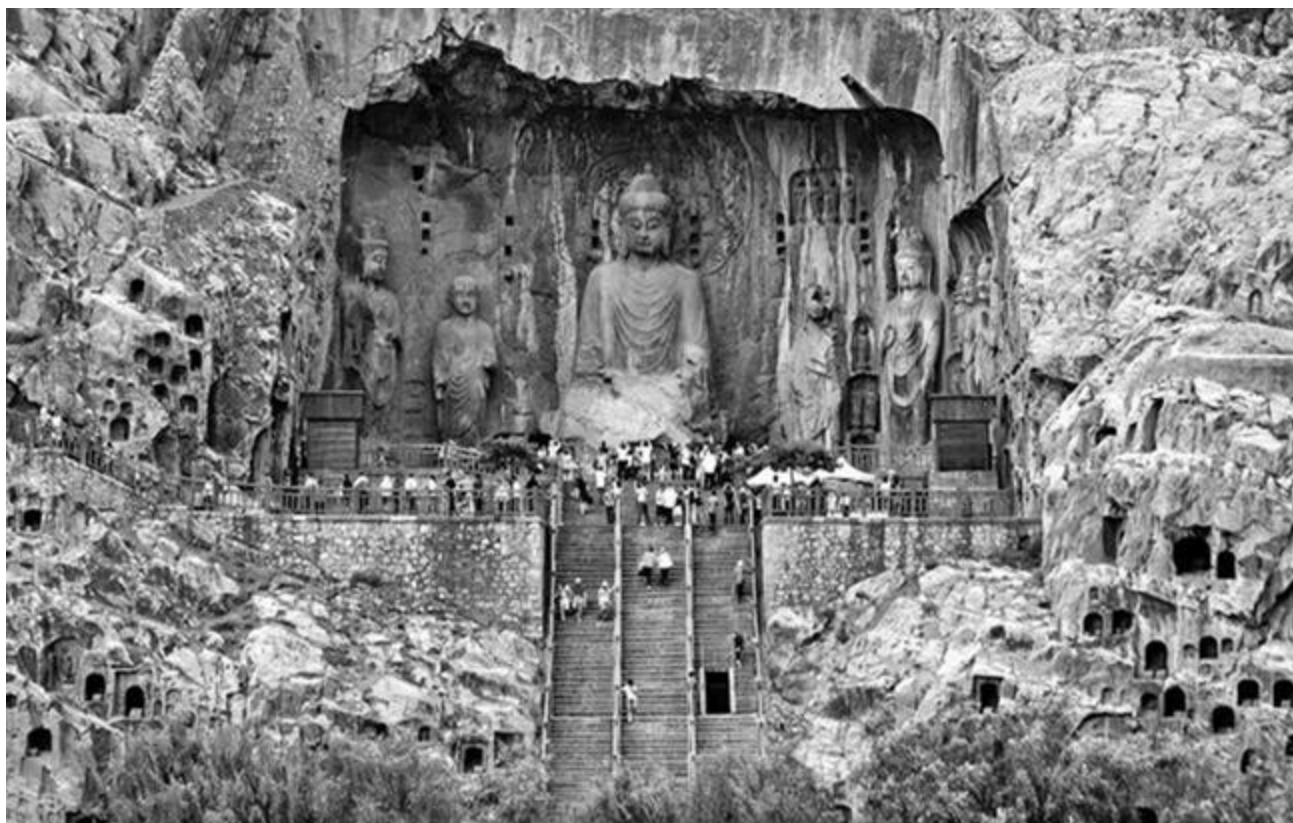
Рисунок 6 - Буддийский храм в гротах Луньмэнь

Буддизм также внес вклад в развитие пейзажной архитектуры, где природные элементы, такие как горы, реки и озера, становятся основой для создания гармоничного окружения.