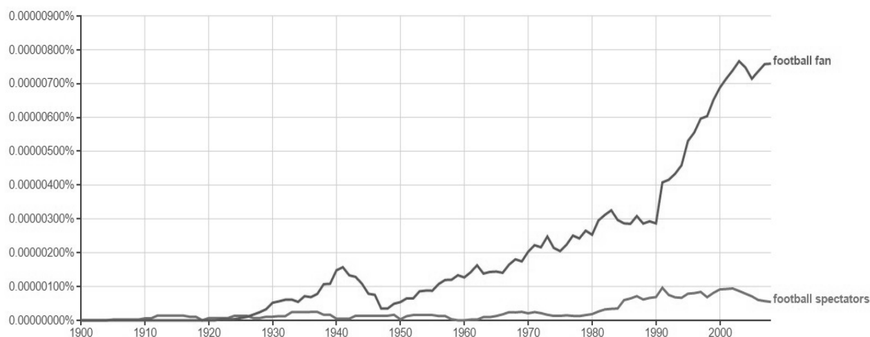
Рисунок 1 - Частота (в процентах) встречаемости «football spectator» & «fan football» в онлайн-сервисе по годам на базе английского языкового корпуса (1900-2008)

сегодняшний день позиция его остается низкой. Корни вышеизложенных выводов, безусловно, кроются в историко-культурологической и лингвистической плоскостях.