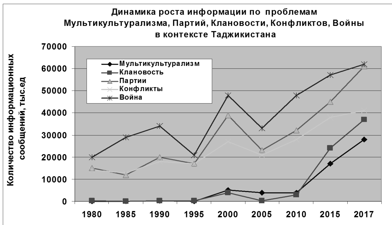
Рисунок 1. Динамика информационного освещения национальных проблем в контексте Таджикистана

Важность этой проблемы осветил Председатель палаты представителей Верховного Меджлиса Таджикистана Шукурджон Зухуров, когда сказал, что мультикультурализм стал одним из ключевых факторов в решении сложных вопросов, он также отметил, что толерантность представляет собой основную часть внутренней и внешней политики Таджикистана: «Опыт Таджикистана является образцом для международного сообщества. Совместное проживание разных народов в одной стране уже стало неотъемлемой частью их жизни. Ответы на многие вызовы мы должны искать в мультикультурализме» [www...].