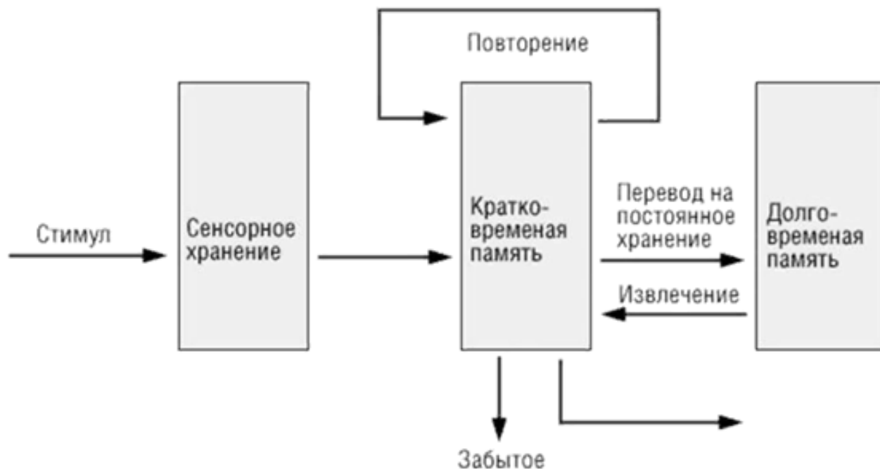
Рисунок 2 – Модель Аткинсона и Шиффрина [Кордуэлл, 2000]

В данной модели человек воспринимает информацию вне зависимости от того, является ли она первичной или вторичной. К примеру, он может воспринимать данные из Интернета или школьный курс истории. Далее эти данные проходят через уровень сенсорного хранения, который является очень кратким, но обязательным. Сенсорная память – память чувств (вкус, зрение, слух и др.). Через сенсорный этап информация переходит на уровень кратковременной памяти, которая аккумулирует информацию на срок менее 20 секунд и не более чем о 5-7 объектах. Наконец из блока краткосрочной памяти информация попадает на уровень долгосрочной памяти, в которой информация может храниться вплоть до конца существования биологического объекта.