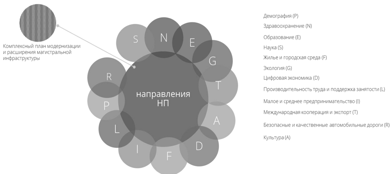
Рисунок 2. Основные направления Указа № 204

Ярким примером применения проектного подхода в Российской Федерации на сегодняшний день является Указ Президента Российской Федерации от 07.05.2018 № 204 «О национальных целях и стратегических задачах развития Российской Федерации на период до 2024 года» (далее – Указ) [17], в рамках которого федеральными органами исполнительной власти разработаны и утверждены паспорта национальных проектов по 12 – ти направлениям: демография, здравоохранение, образование, жильё и городская среда, экология, безопасные и качественные автомобильные дороги, производительность труда и поддержка занятости, цифровая экономика, культура, малое и среднее предпринимательство и поддержка индивидуальной предпринимательской инициативы, международная кооперация и экспорт, наука, а так же (рис.2).