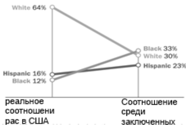
Рисунок 2. Расовое соотношение граждан США на свободе и в тюремном заключении [Drake, www]

Ситуация также осложняется тем, что даже правоохранительные органы дискриминируют цветные меньшинства, о чем говорит не только опрос выше, но и исследование главного редактора Pew Research Center, которое показало, что темнокожие люди в шесть раз больше подвергались тюремному заключению, чем белые (рис. 2).