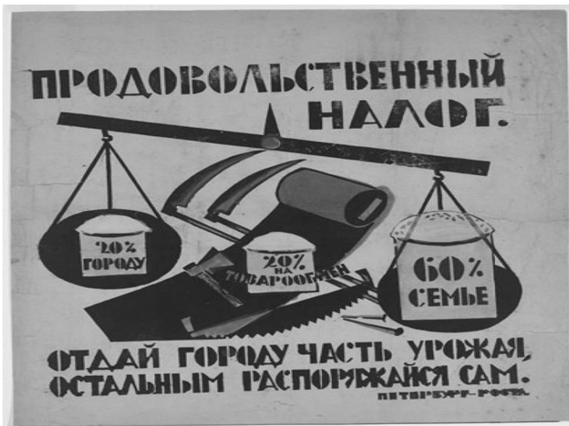
Рисунок 1 - «Агитка» того времени

производства, поскольку чем больше они производили, тем меньше налог они должны были выплачивать.