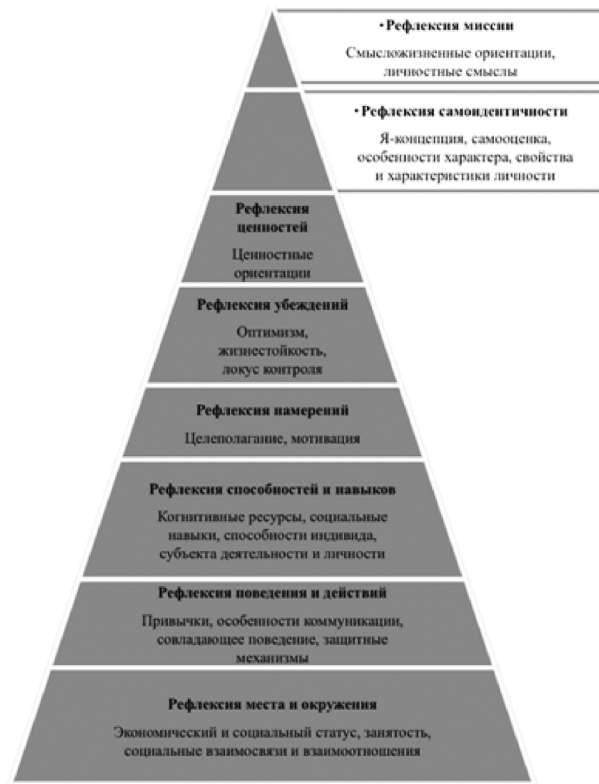
Рисунок 1. Уровни внутренней организации психологических ресурсов человека

Работа с данной проблемой на том же или нижележащем уровне далеко не всегда приводит к эффективным изменениям 22 . Только та работа, которая осуществляется на более высоком логическом уровне, позволяют успешно