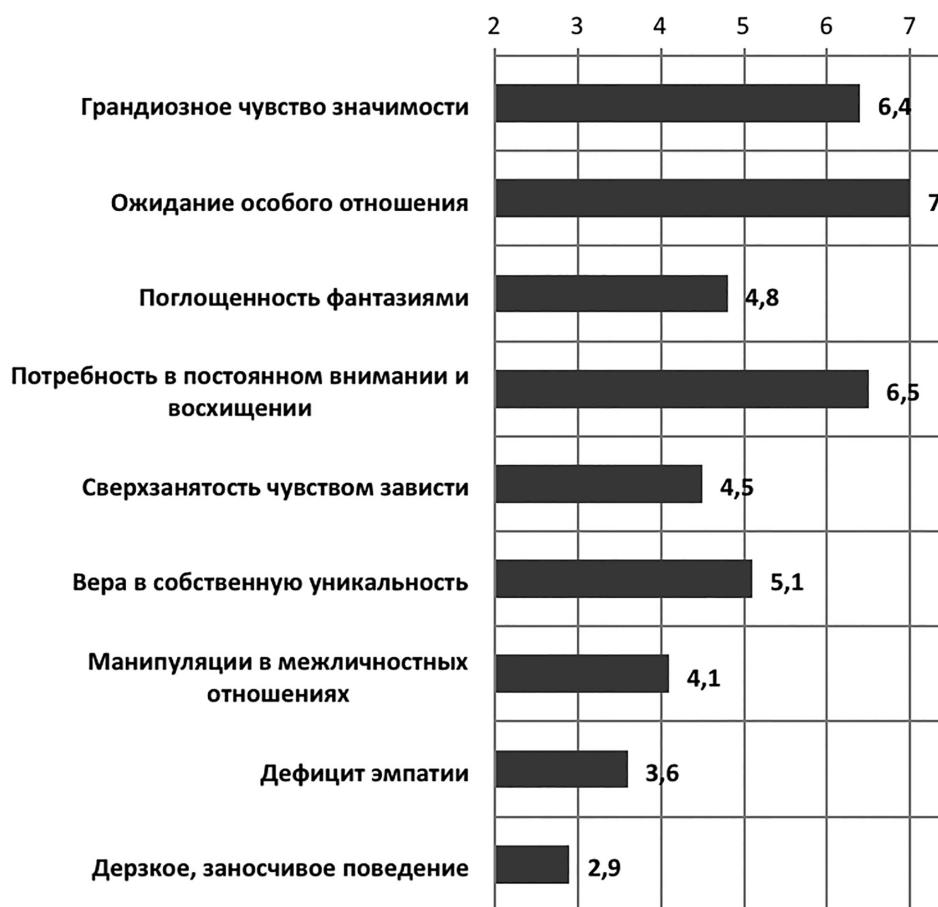
Диаграмма 1. Среднегрупповые показатели выраженности нарциссических черт в выборке студентов-гуманитариев (по шкалам методики «Нарциссические черты личности»)

Следовательно, студенты в целях поддержания позитивного самоотношения и стабильности системы представлений о себе проявляют склонность к ожиданию от социального окружения особенного к себе отношения и формированию высокой значимости себя как