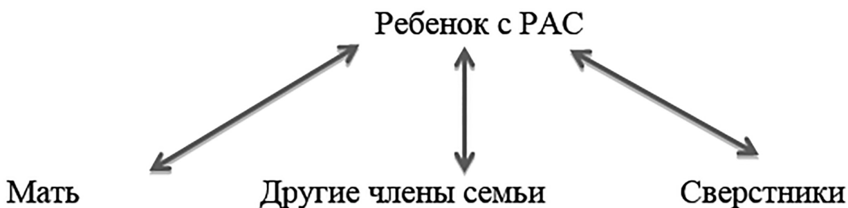
Рис. 2. Схема взаимодействия аутичного ребенка с окружающими.

Итак, мы кратко рассмотрели положения некоторых авторов по вопросу взаимодействия ребенка с аутизмом или с расстройствами аутистического спектра с окружающими по следующей схеме (рис. 2):