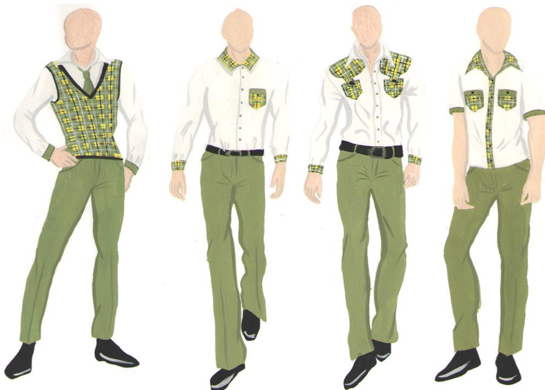
Рисунок 3 – Модели форменной одежды для юношей

были разработаны кроме брючных варианты комплектов, позволяющие использовать юбку и (или) сарафан (рис. 4).