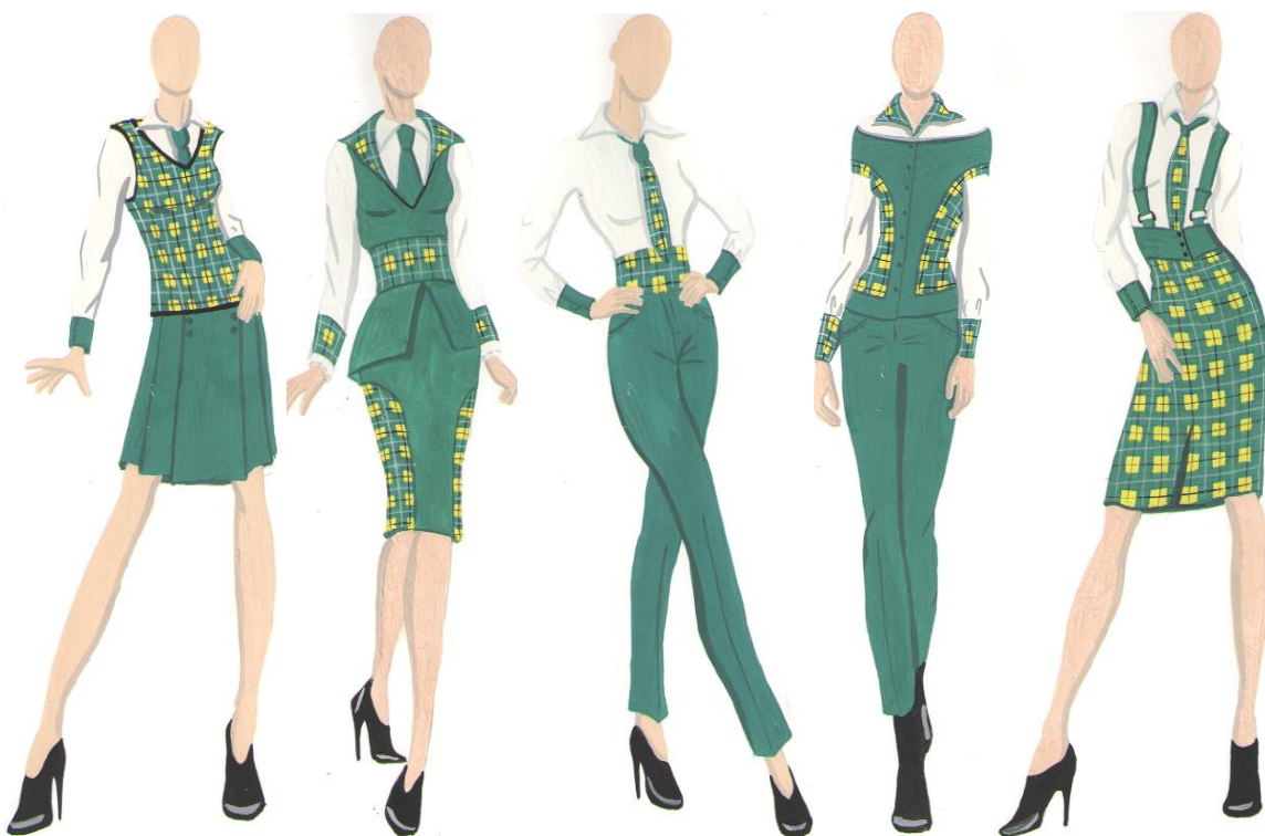
Рисунок 4 – Модели форменной одежды для девушек