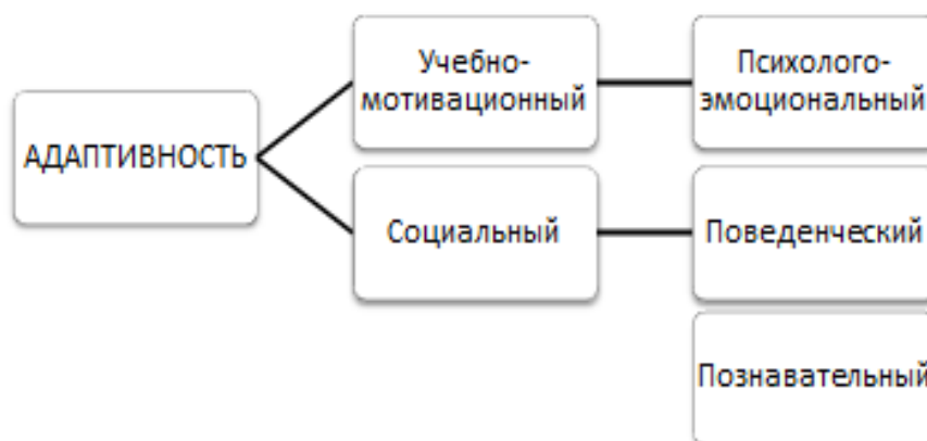
Рисунок 2 - Структура адаптивности личности в учебной деятельности

С.М. Тромбах определил ряд индивидуально-психологических качеств личности в учебной деятельности, интегрируя их в различные блоки (Рисунок 2).