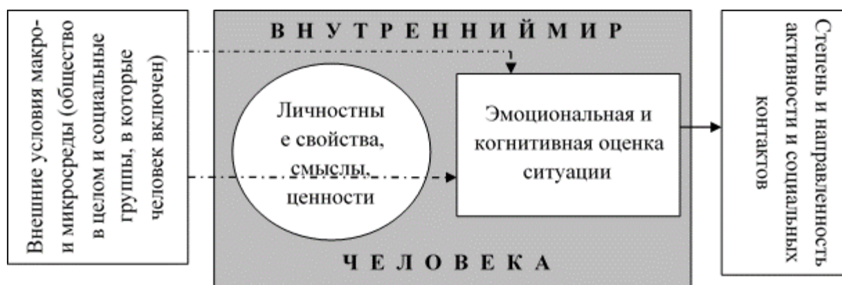
Рисунок 2 - Обобщенное содержание понятия «социальное самочувствие»

Схематично обобщенное содержание понятия «социальное самочувствие» представим ниже на рис. 2. На рисунке показано, что при рассмотрении социального самочувствия влияние на него внутренних личностных переменных может быть как проанализировано авторами, так и оставаться вне области научного анализа.