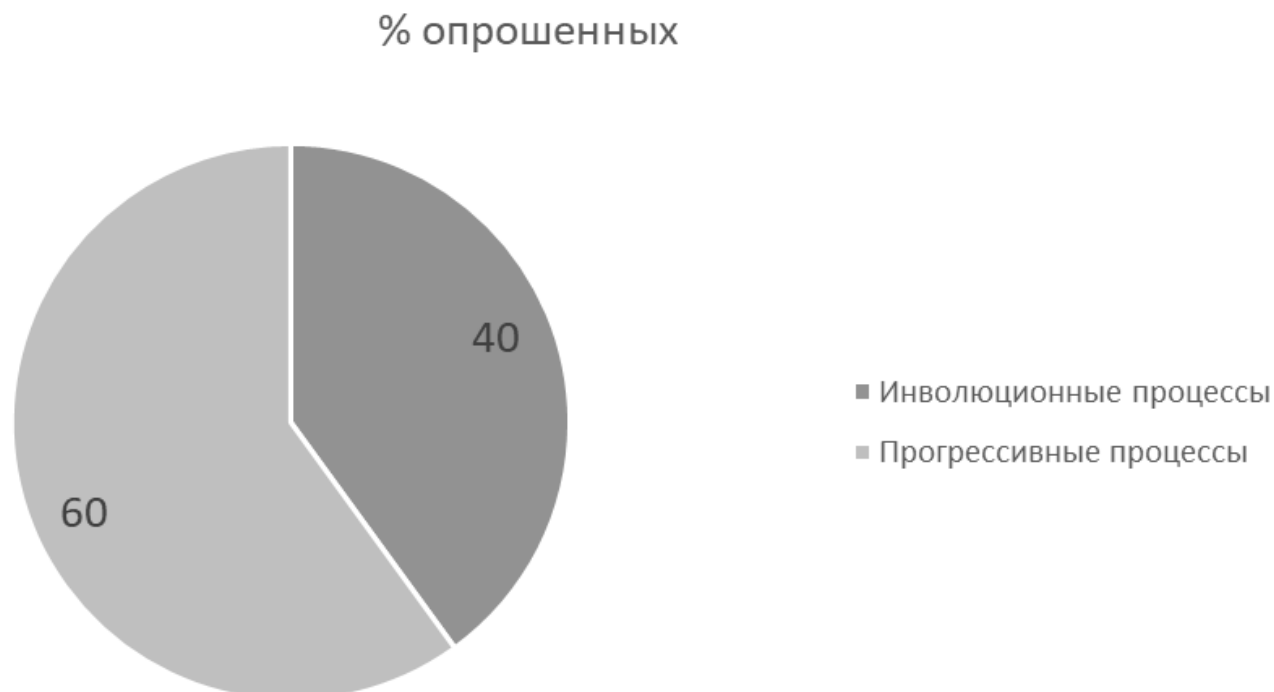
Рисунок 3 - Результаты методики «Неоконченные предложения»