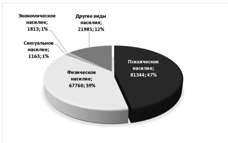
Рисунок 2 - Количество случаев семейного насилия в Польше (по видам) [там же]

Данные по видам семейного насилия представлены на рис. 2: