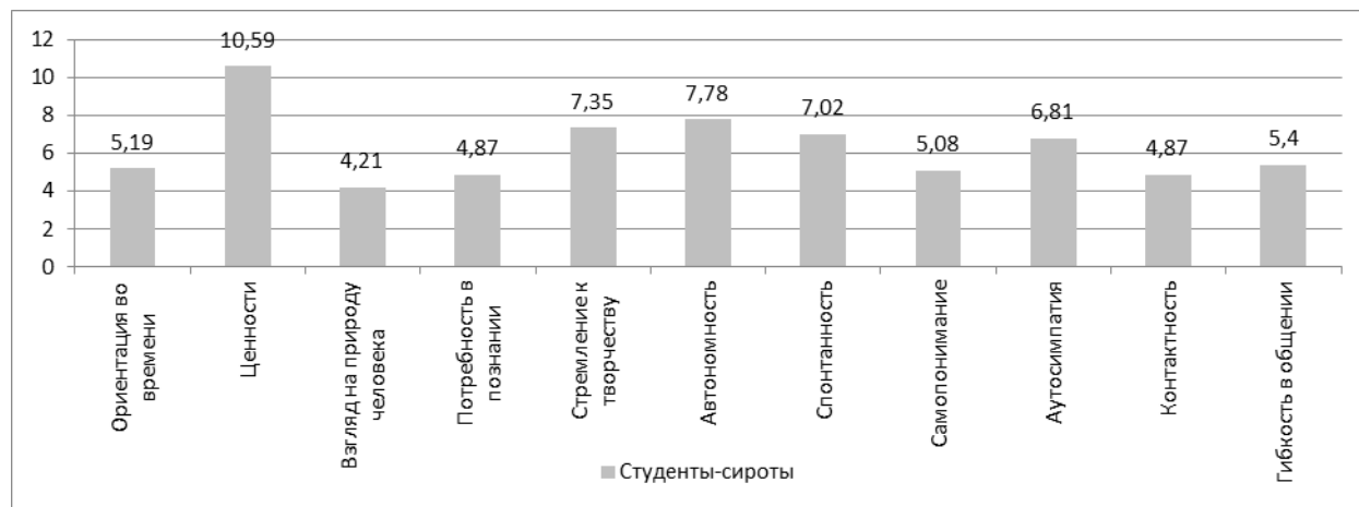
Рисунок 3 - Средние показатели по методике «САМОАЛ» в группах испытуемых (апрель, 2022 г.)

Представленные на рис. 3 данные показывают положительную динамику в социальной адаптивности студентов-сирот. Более высокие показатели показали такие шкалы, как «Ценности», «Автономность», «Самопонимание». Стоит обратить внимание также на такие шкалы, как «Контактность» и «Гибкость в общении». У студентов-сирот данные шкалы показывают положительную динамику.