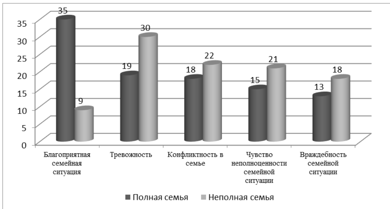
Рисунок 4 - Результаты исследования по методике Бернса-Кауфмана «Кинетический рисунок семьи» в полных и неполных семьях (%)

Согласно теории, К. Хорни тревожность связана с главной потребностью ребенка – в безопасности, которая напрямую зависит от родителей, и, если их поведение не способствует удовлетворению этой потребности, у ребенка возрастает напряженность, повышенная тревожность. Таким образом, можно сказать, что из-за нестабильности окружающего мира ребенка, частых изменений семейной ситуации (развод родителей или смерть одного из них, переезд, появление отчима и т.д.) у ребенка не удовлетворяется потребность в безопасности, что приводит к базальной враждебности. Ребенок в этом случае переживает конфликт: он зависит от матери и в то же время испытывает по отношению к ней чувство обиды и негодования, этот конфликт, вызывающий напряжение проявляется во всех взаимоотношениях с другими людьми.