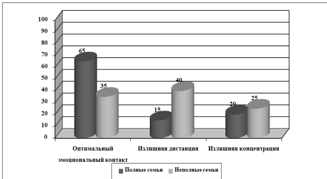
Рисунок 2 - Стили родительского воспитания в полных и неполных семьях (%)

дистанция или авторитарный тип родительского отношения. Однако, и гиперопекающий и демократичный стили воспитания достаточно выражены.