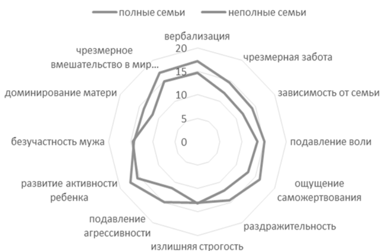
Рисунок 1 - Результаты исследования детско-родительских отношений в полных и неполных семьях

В исследовании мы разделили результаты испытуемых на две группы. К первой группе относятся результаты исследования особенностей воспитания дошкольников в неполных семьях, ко второй группе мы относим результаты исследования особенностей воспитания дошкольников в полных семьях. Для выявления различий между выборками использовался Критерий Манна-Уитни (U).