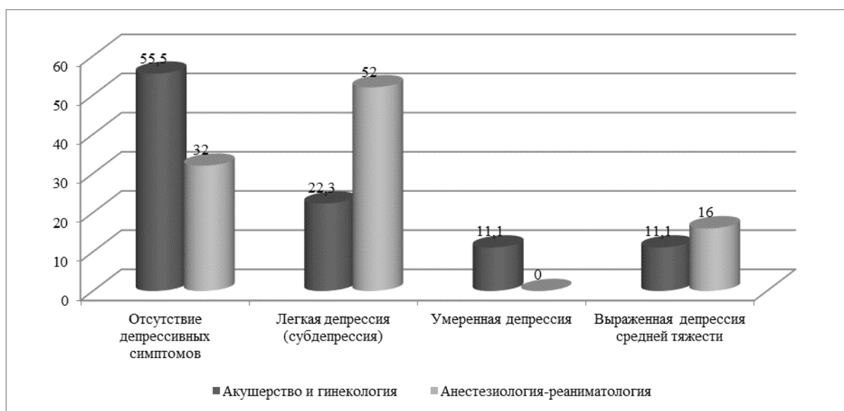
Рисунок 2 - Средние значения шкалы депрессии А.Т. Бека (в адаптации Н.В. Тарабриной) у врачей-ординаторов (составлено авторами по материалам исследования)

Вторым этапом исследования было определение с помощью психодиагностического тестирования по шкале (тест-опросник) А.Т. Бека (Beck Depression Inventory), в адаптации Н.В. Тарабриной наличие уровня депрессии и тяжести депрессивного расстройства у клинических ординаторов (рисунок 2).