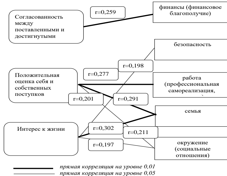
Рисунок 5 - Взаимосвязь индекса жизненной удовлетворенности и факторов удовлетворенности жизнью у лиц зрелого возраста по итогам корреляционного анализа по критерию Спирмена