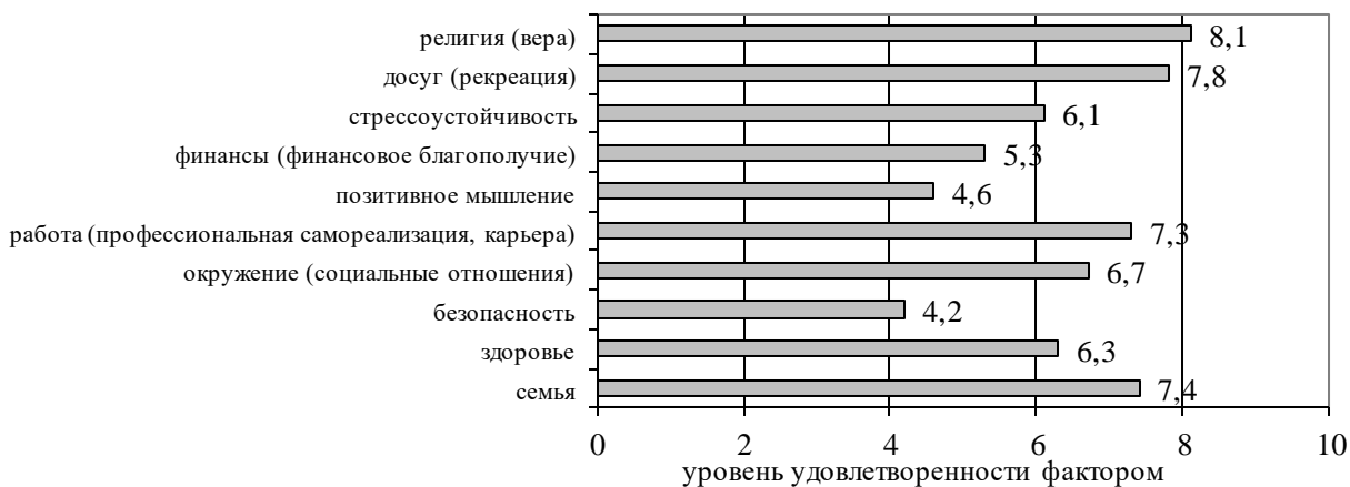
Рисунок 2 - Уровень удовлетворенности каждым фактором у лиц зрелого возраста (ср.зн.)

Итоги проведенного опроса представителей зрелой возрастной категории показали, что на момент анкетирования они в разной степени были удовлетворены каждым из 10-ти факторов, учитываемых в данной работе (Рисунок 2). На наиболее высоком уровне на момент исследования у лиц среднего возраста была удовлетворенность жизнью по таким факторам, как: фактор религии, или веры (8,1); фактор досуга, или рекреации (7,8); фактор семьи (7,4); фактор работы, включающий профессиональную самореализацию и карьеру (7,3); фактор окружения, или социальных отношений (6,7).