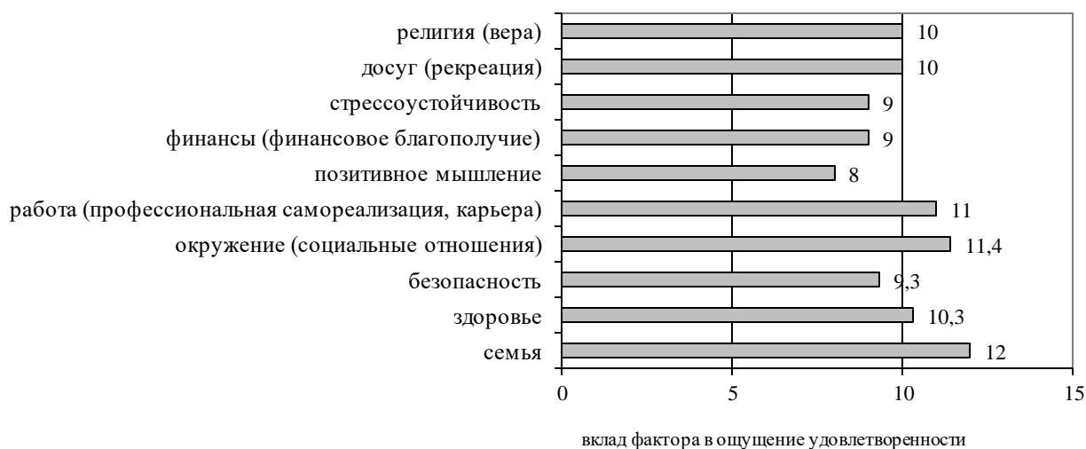
Рисунок 3 - Вклад каждого фактора в удовлетворенность жизнью у лиц зрелого возраста (%)

На пятом этапе проведен анализ вклада (в процентном соотношении) каждого фактора в удовлетворенности жизнью. В данном случае в процентных значениях выявлялась реальная доля каждого изучаемого фактора в удовлетворенности жизнью у лиц зрелого возраста (Рисунок 3).