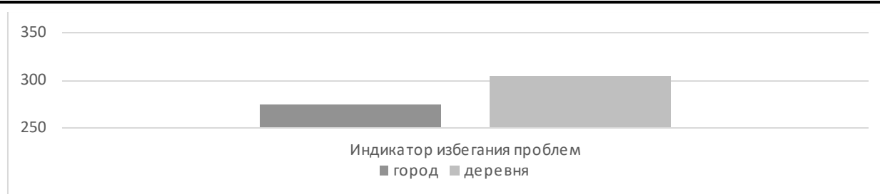
Рисунок 2 - Избегание проблем

Когда они сталкиваются с проблемой, они могут провести анализ, чтобы найти решение, и использовать эффективные стратегии решения проблем [Carpura, Cervone, 2000]. Поскольку эмоционально интеллектуальные подростки обладают самоконтролем, они лучше находят собственные идеи, мотивируют себя и сохраняют ясность в отношениях, когда сталкиваются с проблемами и трудностями. У них может быть способность к самоуправлению, стремление к совершенству и использование разнообразия для решения проблем. Подростки с эмоциональным интеллектом способны проявлять эмпатию и понимание в общении, несмотря на проблемы и трудности. У них есть способность понимать эмоции других и устанавливать дружеские, понимающие отношения с другими. Это повышает их способность легко и искренне подходить к анализу, показателям, советам и поддержке для решения проблем и задач. Подростки с эмоциональным интеллектом лучше справляются со стрессом и беспокойством при решении проблем. У них повышенная способность противостоять стрессу, поддерживать и развивать навыки, чтобы смотреть на свои проблемы, освобождаться, эффективно управлять взаимодействием и находить взаимное воображение для снижения стресса [Mayer, Salovey, Caruso, 2008].