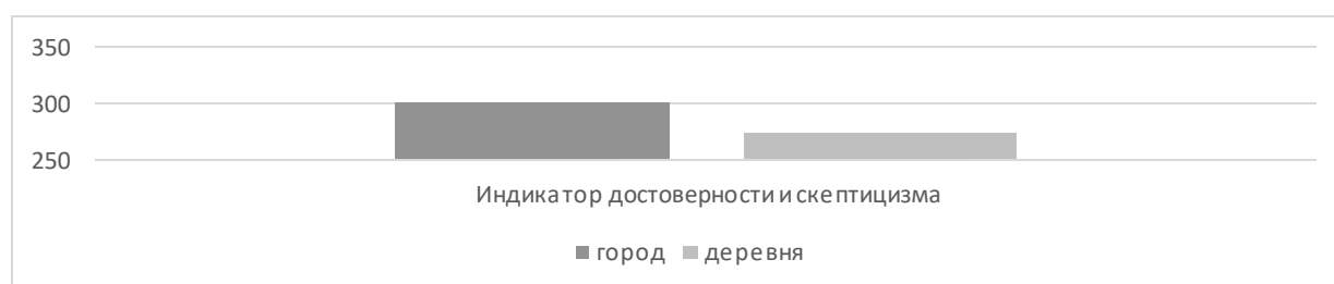
Рисунок 4 – Достоверность и скептицизм

Мы можем наблюдать достоверные различия в индексе достоверности подозрительности ( U=37287000 ; p>0,05 ). Мы видим, что подростки, живущие в городах, более подозрительны, чем подростки, живущие в сельской местности (Диаграмма 4).