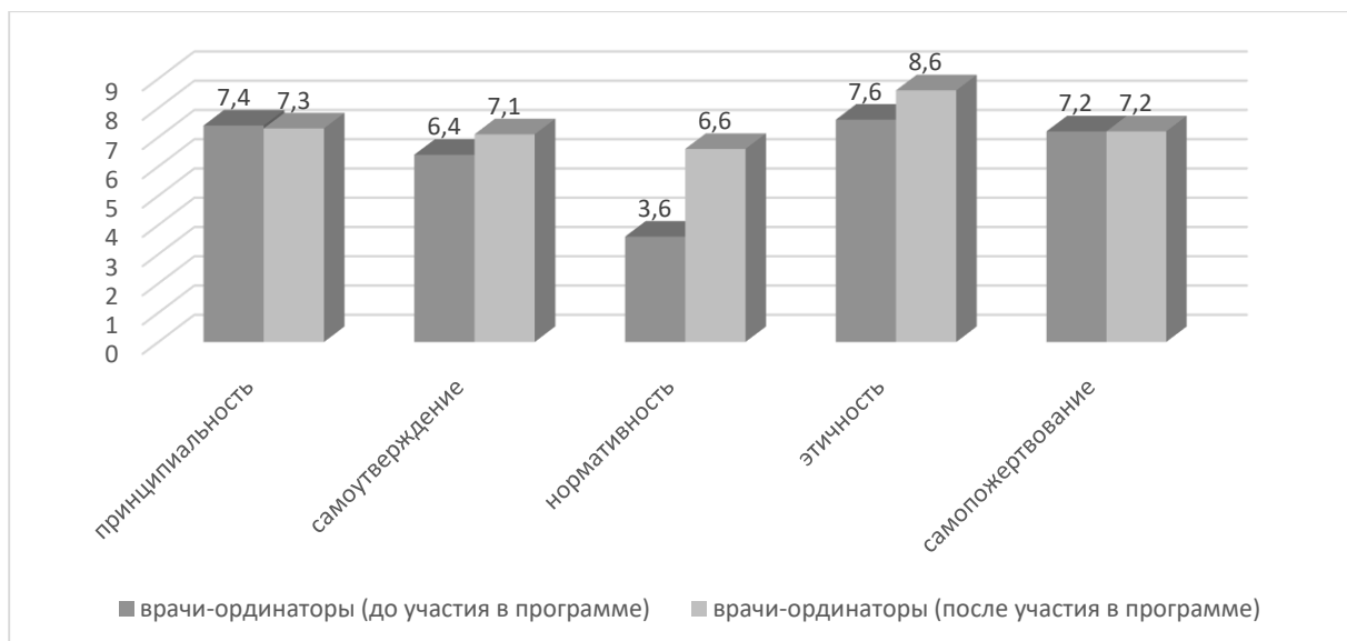
Рисунок 1 - Средние значения по методике «Оценка профессиональной адаптации» (автор: Дмитриева М.А.) у клинических ординаторов

(составлено авторами по материалам исследования)